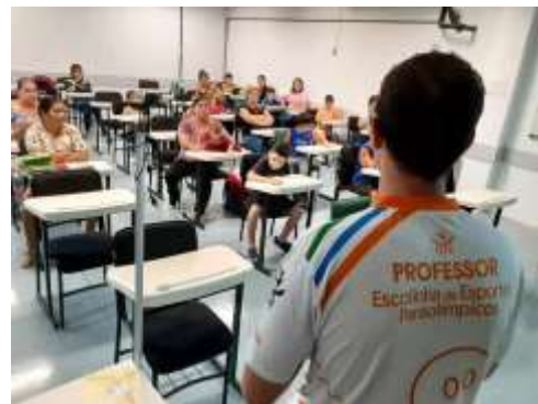
REUNIÃO “BOAS VINDAS”- FAMILIARES ESCOLINHA