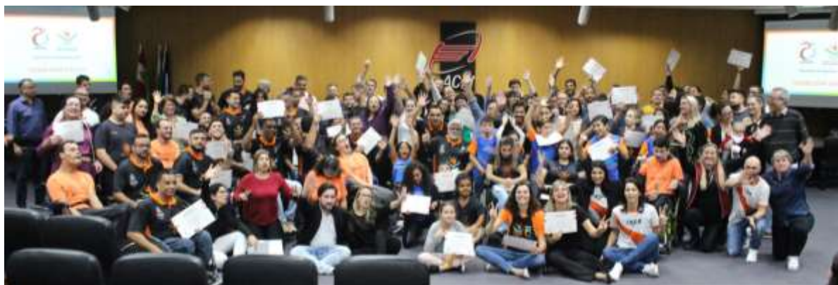
Evento na ACIJ (Associação Empresarial de Joinville) Parceiros e Patrocinadores em comemoração aos 20 anos CEPE