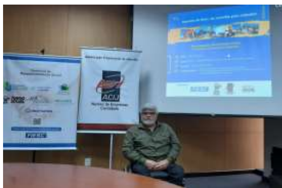
Representação no seminário na ACIJ ‘IMPOSTO DO BEM DE JOINVILLE PARA JOINVILLE’