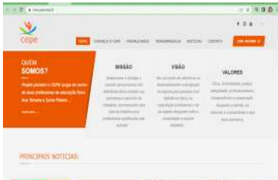
Criação de um novo SITE Institucional