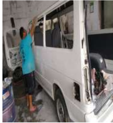
Reforma da TOPIC