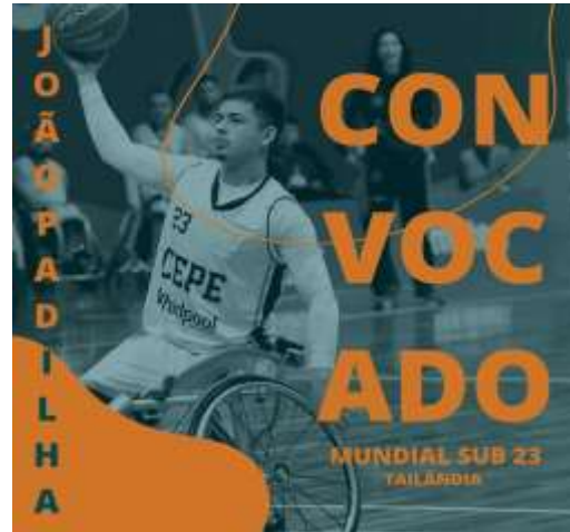
MUNDIAL 23 - TAILÂNDIA