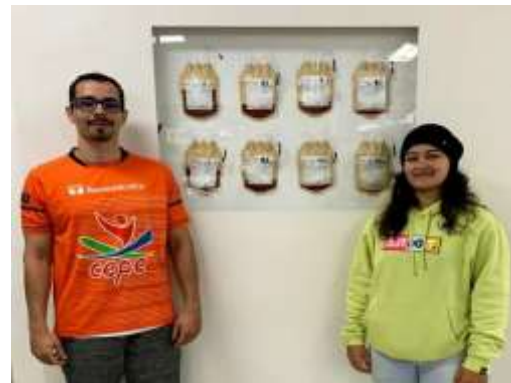
Doação de Sangue