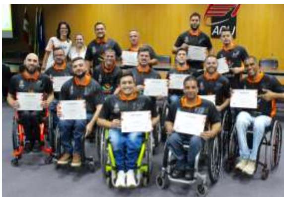
BASQUETEBOL EM CADEIRA DE RODAS