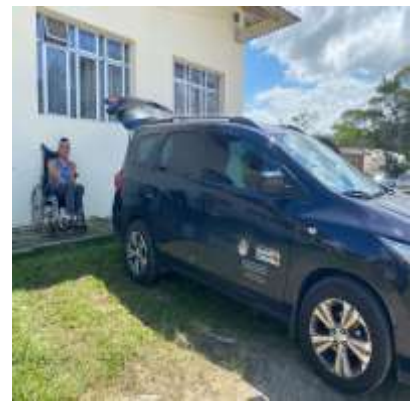
Aquisição Carro SPIN