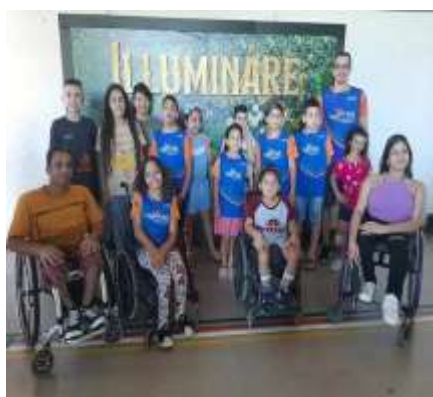
Show Illuminare Evento Natal