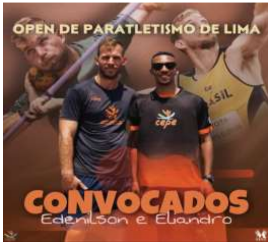
OPEN DE LIMA