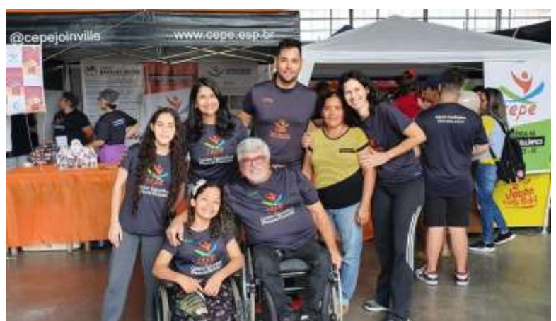
PARTICIPAÇÃO 2ª EDIÇÃO STAMMTISCH DO BEM