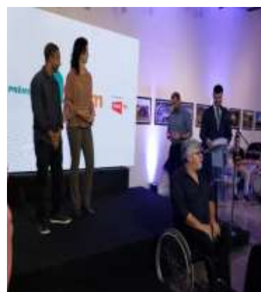
CEPE vencedor do Prêmio “Joinville Faz Bem” NSCTV. (Categoria Esporte)