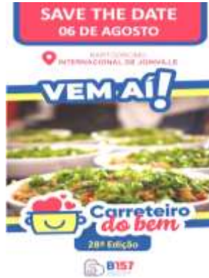
CEPE contemplado Carreteiro do Bem. /Associação B157