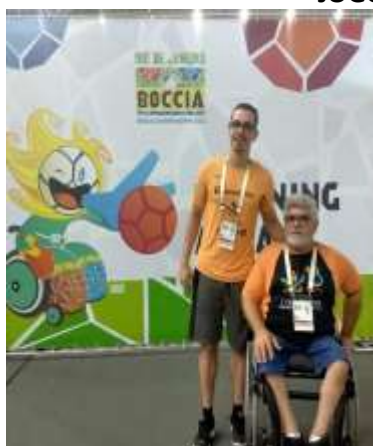
ACOMPANHAMENTO MUNDIAL BOCHA PARALIMPICA