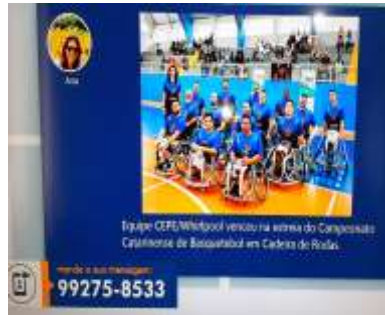
NSCTV JORNAL DO ALMOÇO