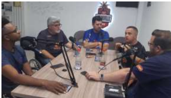
PODCAST RÁDIO TV JOINVILLE WEB