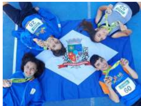
JOGOS ESCOLARES PARADESPORTIVOS DE SC