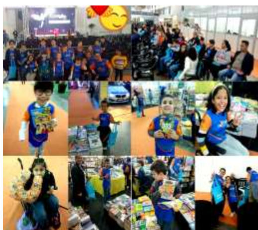
ALUNOS ESCOLINHA NA FEIRA DO LIVRO