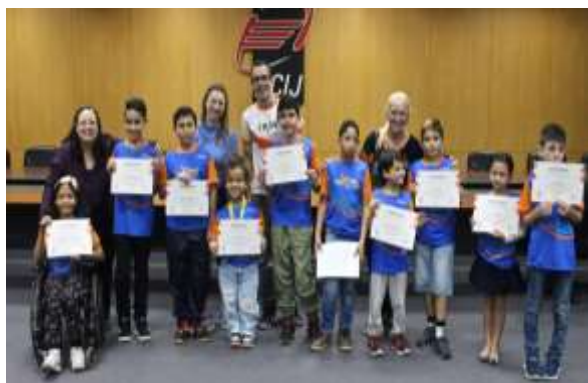
ESCOLINHA DE ESPORTES CEPINHO