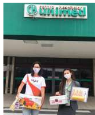
Projeto Troco na Lata