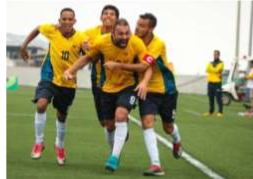
COPA DO MUNDO / ESPANHA