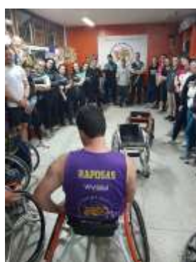
ACADEMICOS DO ENSINO SUPERIOR DA UNIVERSIDADE UNIVILLE: TEORIA E VIVÊNCIA PRÁTICA