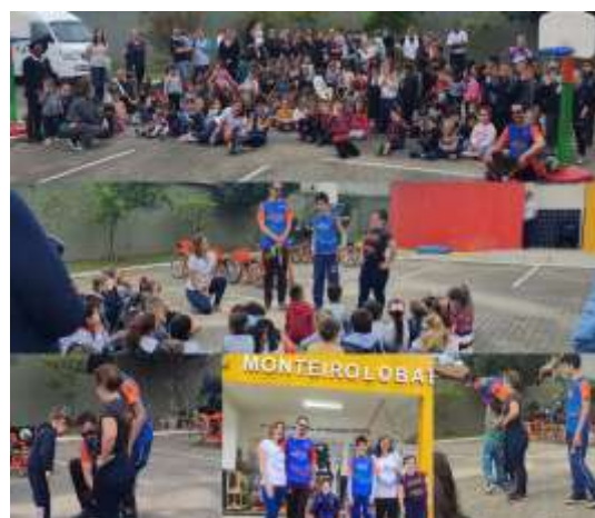
TROCA DE EXPERIÊNCIAS E VIVÊNCIAS NO CEI