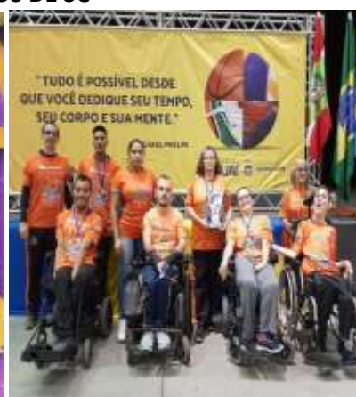
SULBRASILEIRO BOCHA PARALIMPICA